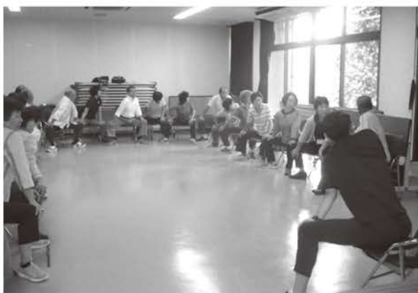
自分の体と向き合うことで、活動も意欲的に。