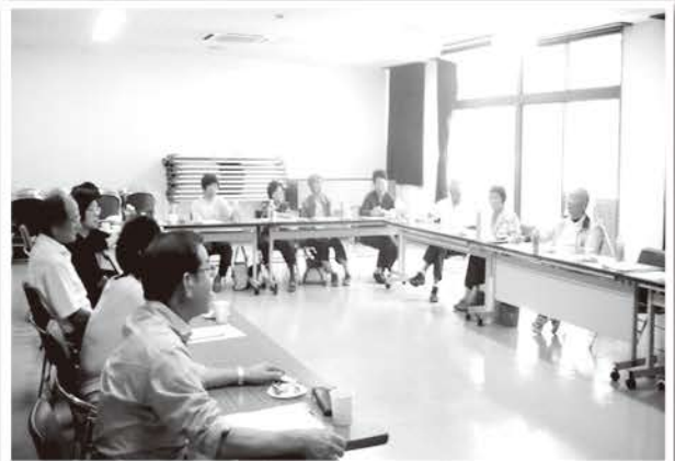
本匠のことを考える表情は、「しら真剣！」