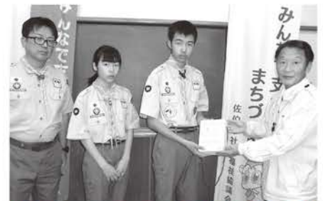
日本ボーイスカウト大分県連盟津久見第1団