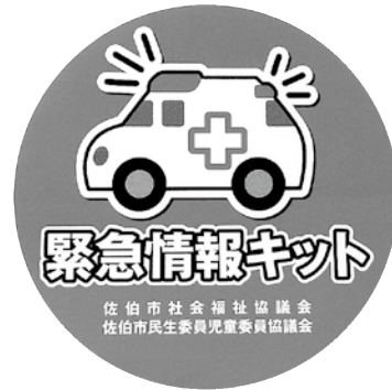
玄関裏・冷蔵庫用シール

また、緊急情報カードに記載されている情報は、民生委員が年に一回、ご自宅を訪問し内容を確認しています。