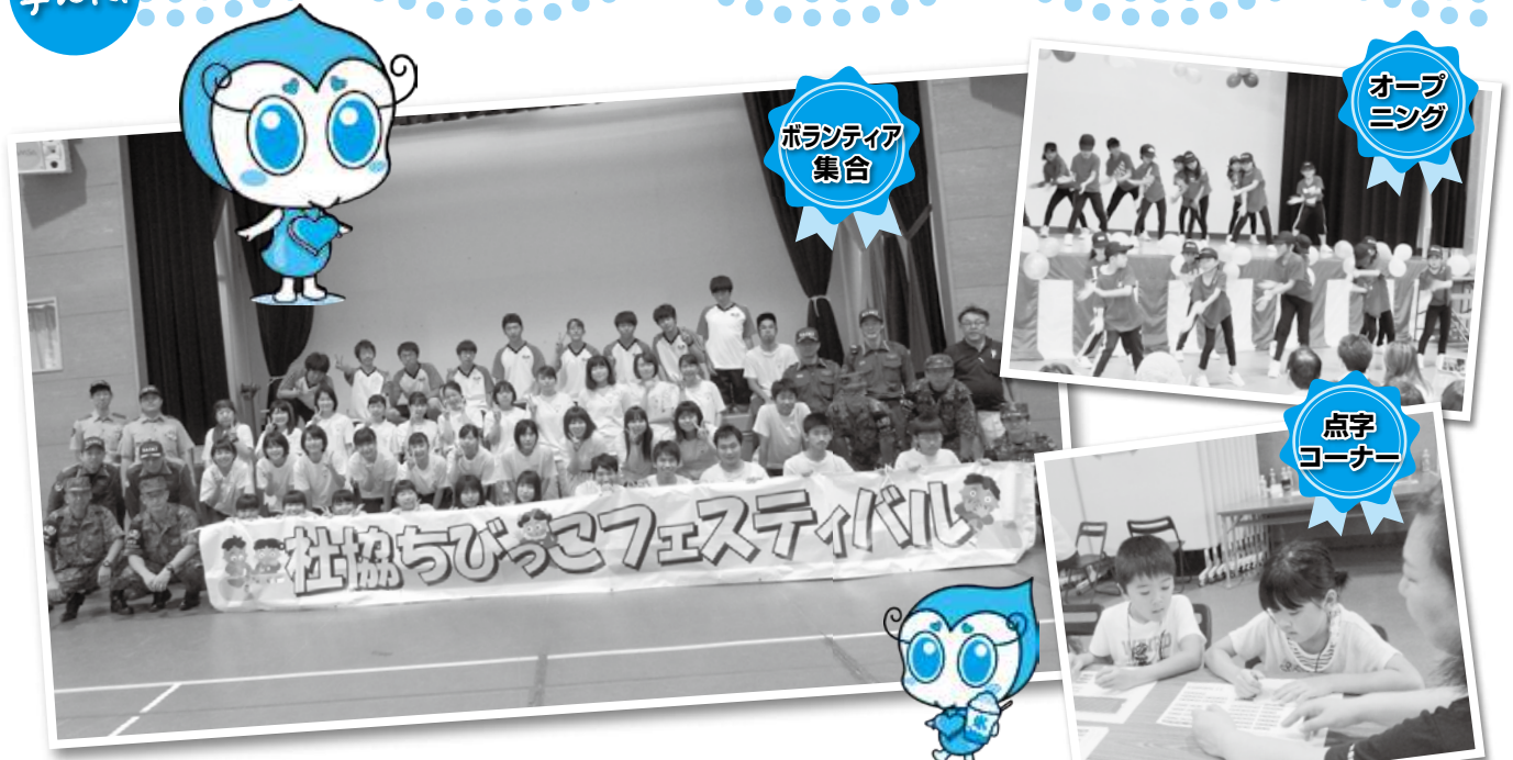
ボランティア 集合