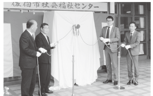
代表者による除幕を行いました

今後も、地域福祉事業の安定的な事業運営を目指し、設置台数の増加に向けた取り組みを進めていくことを確認しました。