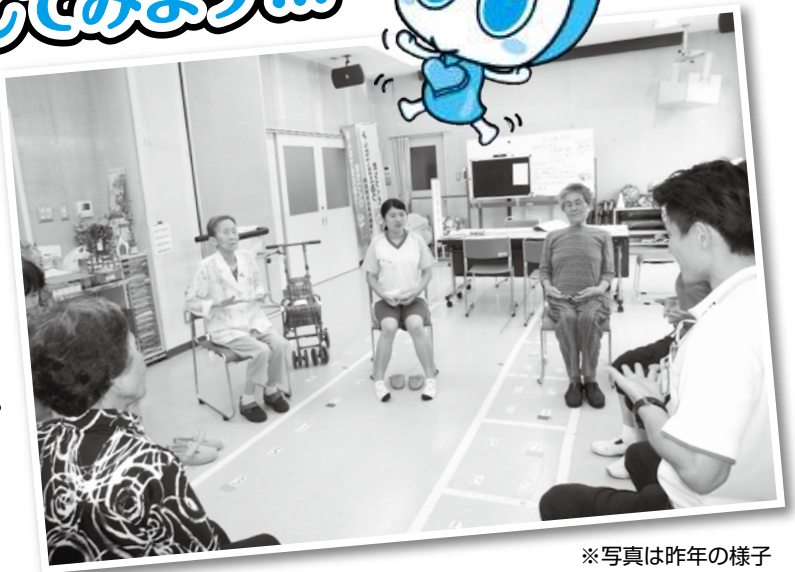
※写真は昨年の様子