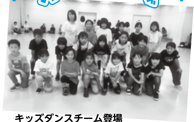
キッズダンスチーム登場 出演者 「garam ガラム」