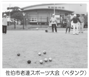
佐伯市老連スポーツ大会（ペタンク）

佐伯市老人クラブ連合会には、佐伯・上浦・本匠・宇目・直川・鶴見・米水津・蒲江の8支部があり、各支部は一つ一つの老人クラブからなりたっています。（計77のクラブがあります。）