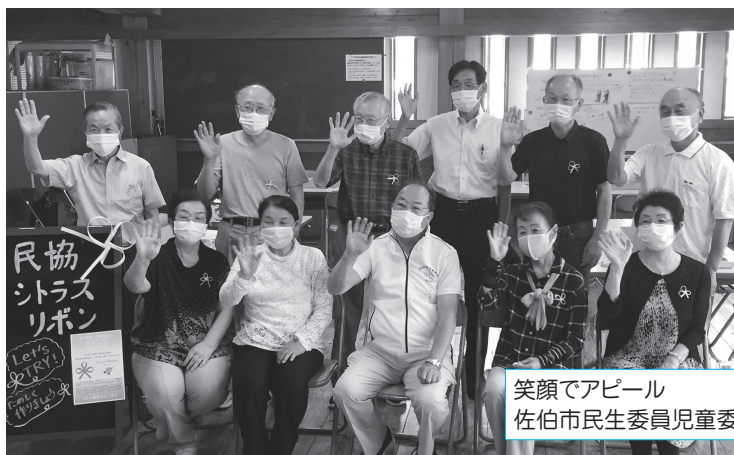
笑顔でアピール 佐伯市民生委員児童委員協議会