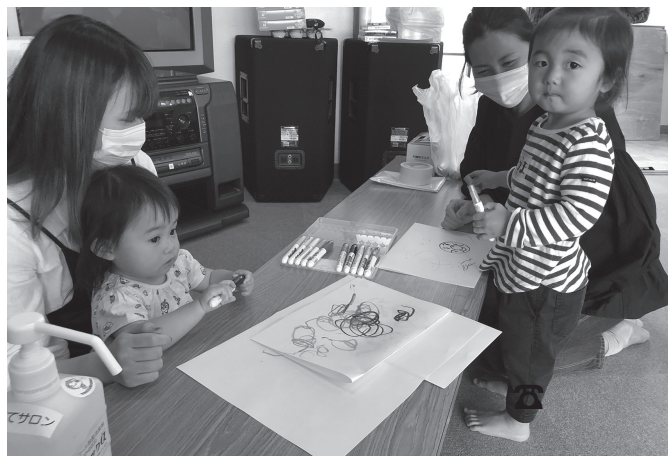
子育て世代の交流の場