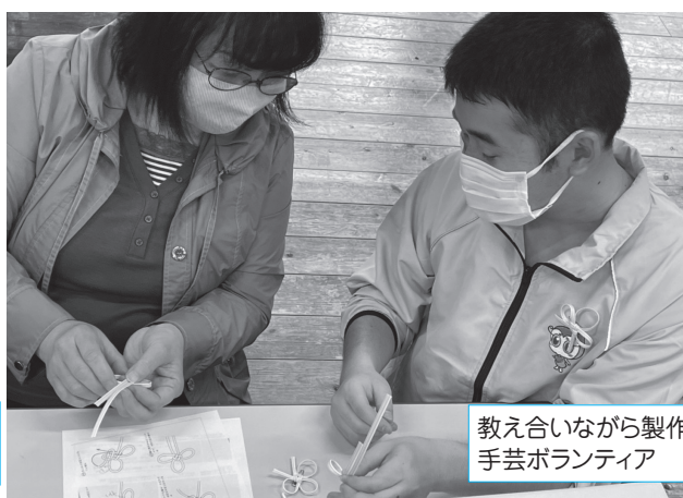
教え合いながら製作中 手芸ボランティア