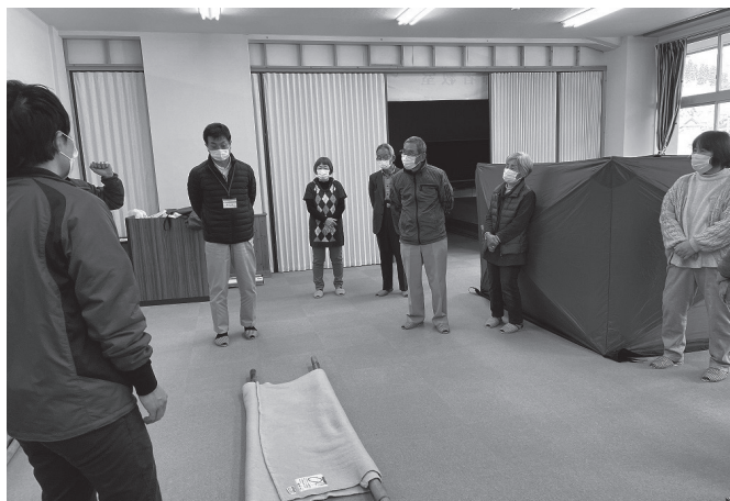
簡易タンカを使った防災研修