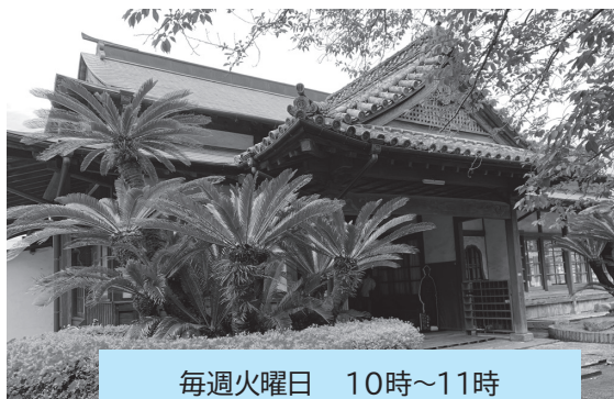
毎週火曜日 10時～11時 住吉御殿（佐伯唯一の御殿）で開催

参加されている90歳代の方が、「ここに来るようになって、足腰が丈夫になったんよ」「ここに来ることが楽しみ」と話されたことです。やって良かった!これからも頑張ろうとますます力が湧きました。