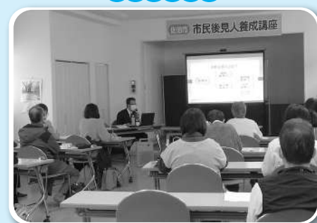
市民後見人養成講座