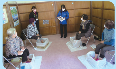
段ボールとビニール袋でできる簡易的な足湯体験♪

◎お話をしている中で、「避難場所への道が険しすぎて、辿り着けるか自信がない」などの不安な声も聞かれ、地域の課題も見えました。 ◎被災地では、実際にボランティアによる足湯が提供されています。リラックス効果があり、被災者の体と心をほぐします。