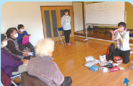
支援員が実際に自宅で保管している防災リュックの中身を紹介！

1月下旬に起きた震度5強の地震。これまでにない激しい揺れに恐怖を感じるとともに、改めて災害に対する備えの重要性を感じたのではないのでしょうか。そこで今回は、防災リュックの紹介と、避難所で行われる足湯の体験をしました。