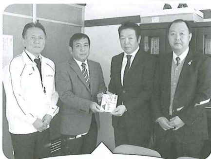
大分銀行4店合同コンペ