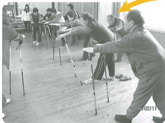
杖を使った柔軟体操 腰が伸びています!

ノルディックウォークとは、北欧のフィンランドにおいてスタートした2本のポールを使ったウォーキングです。日本でも全身運動の効果が高い歩行練習と注目されて、年々愛好者が増えているそうです。2月に本匠の3つのサロンで大分県ノルディック・ウォーク連盟から講師を招いて講習会が開催され、高齢者を中心に60名近い参加者がありました。参加者は両手にカラフルなポールを握り、正面を向くだけで背筋がピンとし、正しく歩こうという意識が芽生えたようです。