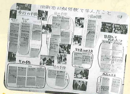
学んだことをまとめてみました！

蒲江地域の小学校統合に伴い、3月末で閉校する西浦小学校ですが、最後の6年生で福祉もりあげ隊を結成したことで、地元を知り身近に感じる事ができました。