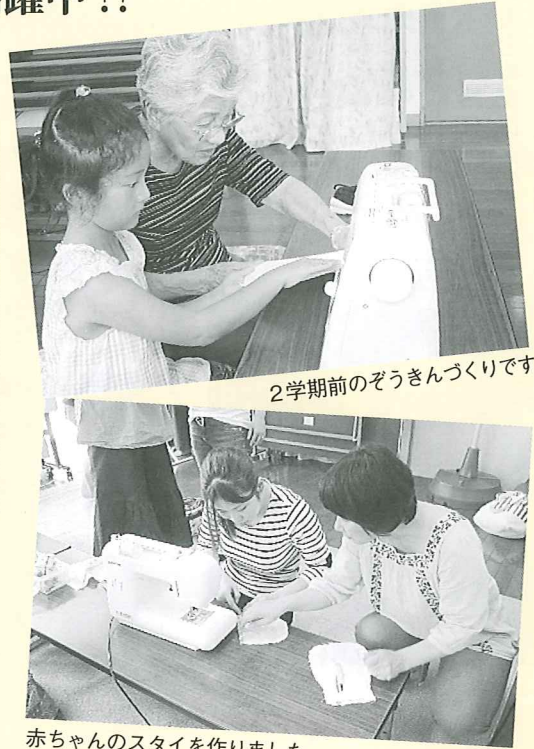
2学期前のぞうきんづくりです