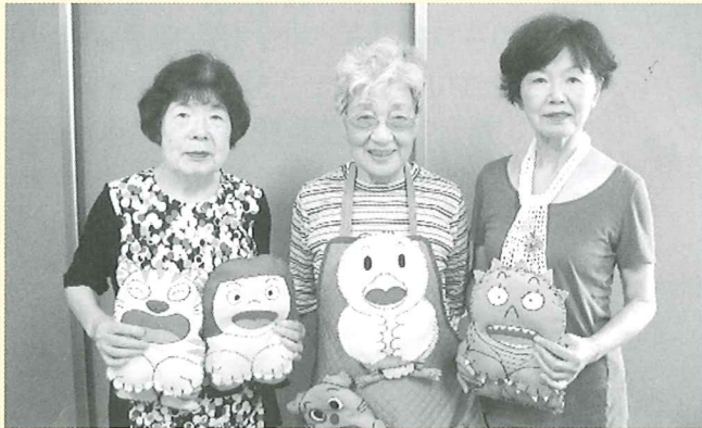
とてもかわいい「いないいないばあ」の絵本がエプロンシアターに!