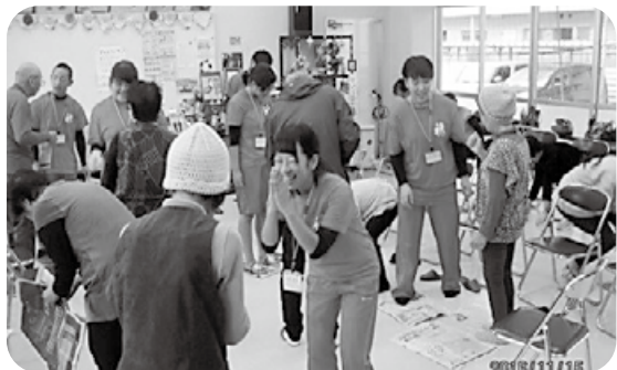
平成28年度 交流会の様子