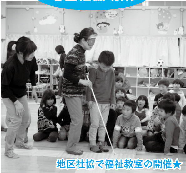
地区社協で福祉教室の開催★