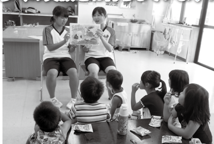
※写真はいずれも昨年の様子