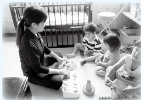
児童館での一時預かりの様子