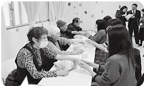
平成27年度 交流会の様子

～「孤立ゼロ社会を目指して」を目標に、高校生と協力しておこなうモデル的な取り組み～