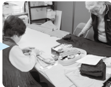
「結いの会」作業の様子▶