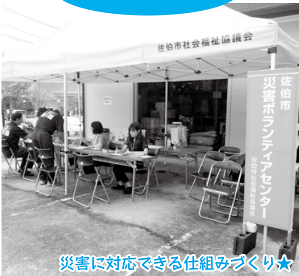
災害に対応できる仕組みづくり★