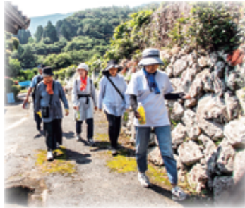
おしゃべりしながら 楽しみながら健康づくりと支えあい活動中です

見守り隊は、ウォーキング仲間同士が自身の健康づくりを楽しみながら、高齢者宅を訪問しています。顔を合わせたり、なにげない会話をすることで、「安心や嬉しい（ハッピー）を届けたいですね」と明るく話されます。無理せずに、今できること、お互いさまの活動が地域に広がっています。