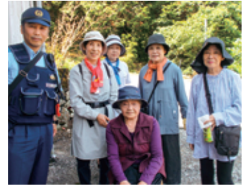
こんにちは～ 今日も良い天気ですね おかわりありませんか～