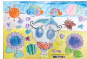
1・2年部門 久米 莉央さん(1年) 蒲江