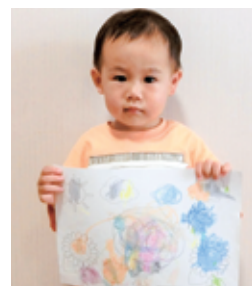
0・1・2歳部門 いけがみ はるきくん(2歳) 佐伯