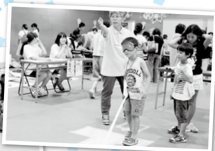
『白いつえを使って まっすぐ歩いてみよう』