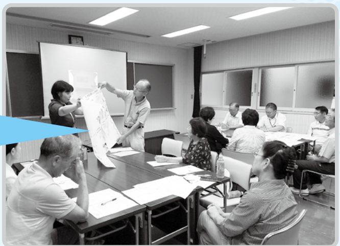
《直川地区での様子》