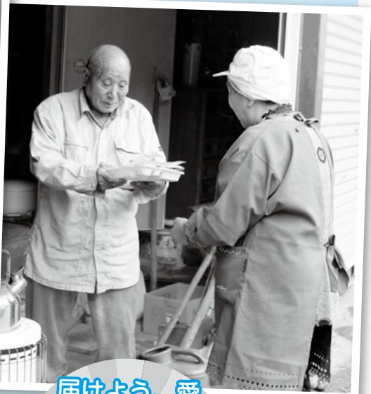
届けよう、愛 「木立地区社協配食サービス」