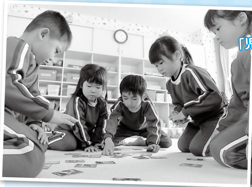
昔あそびを楽しもう! 「児童クラブでカルタとり」