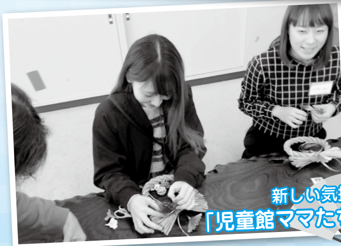
新しい気持ちで新年を 「児童館ママたちのしめ縄づくり」