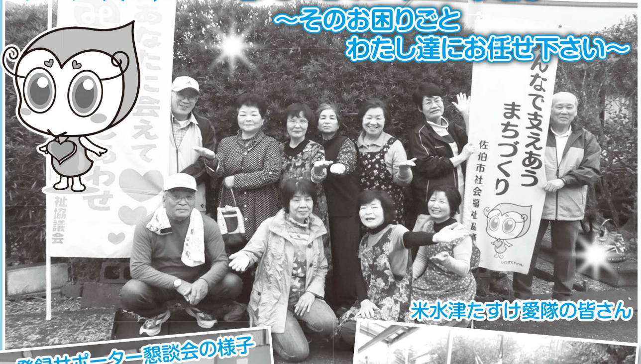
米水津たすけ愛隊の皆さん