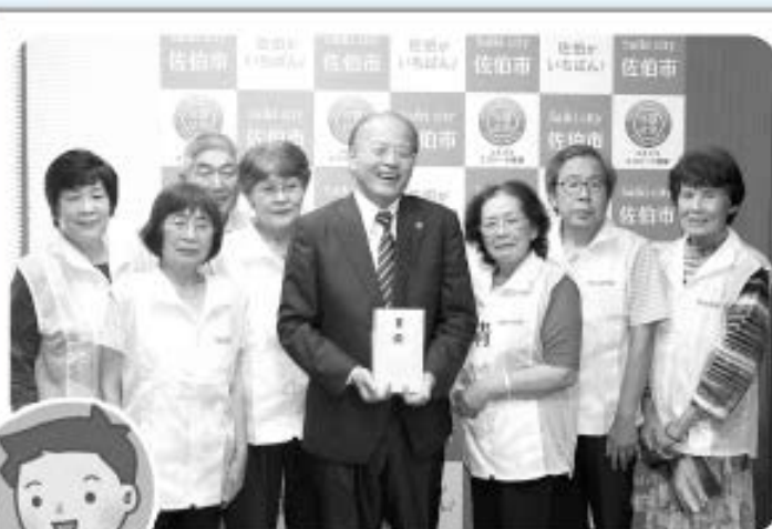
義援金受け渡し式